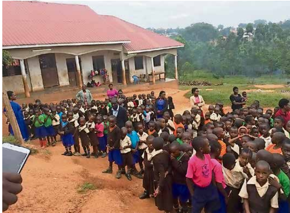
Derzeit hat die „Hidden Treasure Nursery & Primary School“ in Kibibi, Uganda, 470 Schülerinnen und Schüler. Es sollen einmal 1000 sein, ein Viertel davon kostenlos betreut.