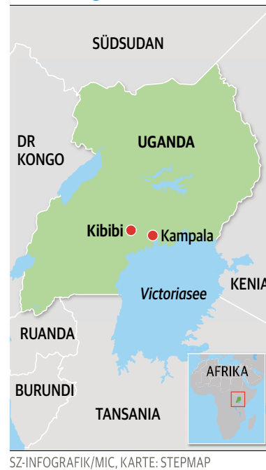
SZ-INFODAT/MIK, KARTE: STEPMAP

Der Name der Schule „Hidden Treasure“, also „Versteckter Schatz“, ist gewissermaßen Programm, schildert Dieter Schmitt: „Der Name ‚Hidden Treasure‘ wurde gewählt, weil viele Kinder versteckte Talente in sich tragen, die sich während einer Schulausbildung herausbil-