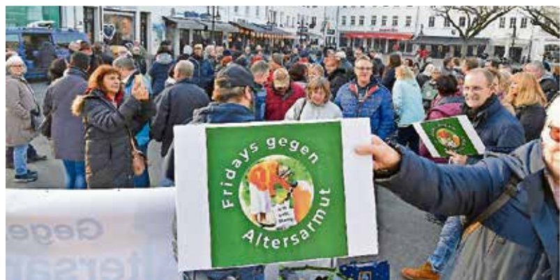
Nach Angaben der Polizei kamen rund 200 Demonstranten zur Mahnwache „Fridays gegen Altersarmut“ auf dem St.Johanner Markt.

SAARBRÜCKEN (aie) 107 hatten auf Facebook zugesagt, am Ende wurden es laut Angaben der Polizei 200. So viele meist ältere Menschen versammelten sich vergangenen Freitag ab 16 Uhr zur Mahnwache unter dem Motto „Fridays gegen Altersarmut“ am St. Johanner Markt in Saarbrücken. Bundesweit waren Dutzende solcher Aktionen angekündigt.