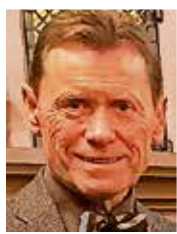
Martin Zewe

HEUSWEILER (dg) In Heusweiler werden im Einmündungsbereich Trierer Straße/Jakobstraße Versorgungsleitungen neu verlegt. Daher wird voraussichtlich ab Montag, 27. Januar, bis zum 3. April unter anderem ein Teilstück der Jakobstraße halbseitig gesperrt. Zudem werden dort zwei Fußgängerampeln eingerichtet, teilte die Heusweiler Gemeindeverwaltung mit. www.heusweiler.de